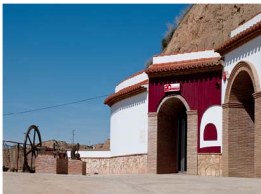
Museo del pueblo de Benalúa

El museo ubicado en una cueva con tres grandes salas y con unos modernos recursos audiovisuales ofrece un recorrido por la historia, gentes y tradiciones del pueblo de Benalúa.