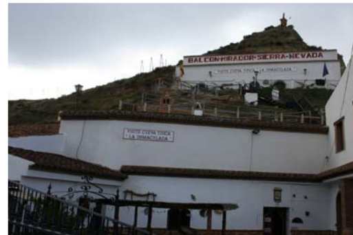
Cueva Museo la Inmaculada

En esta visita didáctica y cultural recorrerá tres casas-cueva con varios siglos de historia. La primera cueva está ambientada en cómo se vive en la actualidad, para mostrar a los visitantes la forma cotidiana de vivir en las cuevas de la Comarca de Guadix. La segunda cueva está decorada igual que una cueva habitada a finales del S-XIX y principios del S-XX. La tercera cueva está en la parte más alta de la montaña, y además de ser un Museo Etnológico, con una amplia exposición de objetos antiguos usados durante muchos años, también es un mirador, desde donde se divisa una bella panorámica del entorno de cerros y cuevas del Valle de los Ríos Alhama Fardes, además de Sierra Nevada.