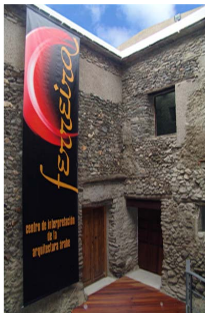
Centro de Interpretación de la Arquitectura Árabe

Dentro de la recién restaurada Alcazaba Árabe y ocupando asimismo algunas dependencias de la también remodelada casona morisca conocida como 'Casa Grande', se ha instalado este moderno y novedoso centro de interpretación donde, por medio de un discurso fresco y pedagógico, podemos acercarnos al legado árabe presente en el Marquesado del Zenete. Todo ello utilizando las más variadas tecnologías, desde el tradicional audiovisual hasta modernas recreaciones virtuales, escenografías, hologramas y personajes corpóreos.