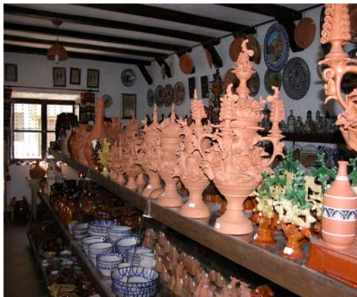
Cueva Museo La Alcazaba

En las faldas de la Alcazaba en una cueva árabe del año 1435, aproximadamente, se ubica este museo de la alfarería que contiene una importante colección de piezas de cerámica de la comarca, así como un espacio didáctico con un torno de alfarero en el que se realizan exhibiciones. Junto al museo se encuentra el taller de alfarería que dispone de una tienda y se puede visitar.