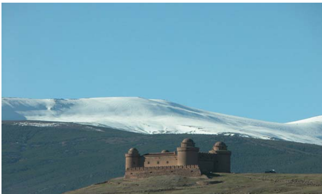
Castillo -Palacio de La Calahorra

fortificación precedente de época medieval, en un cortísimo periodo de tiempo a principios del siglo XVI. El castillo es un edificio singular no sólo por su aspecto y su ubicación, que lo convierten en el elemento de más carácter en el paisaje del Marquesado, sino también por la originalidad de su concepción y ejecución. En él confluyen tres corrientes constructivas y estilísticas diferentes: la arquitectura defensiva castellana, el renacimiento más puro y el mudéjar. El resultado es una fortaleza en su aspecto exterior y un exquisito e íntimo palacio en su interior.