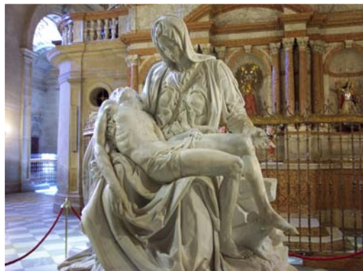
Catedral de Guadix

El museo diocesano de la Catedral de Guadix ofrece una selección de obras de pintura, escultura, orfebrería, bordados y documentos dedicados al arte sacro. También podrá visitar el interior de la Catedral.