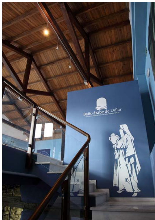
Baños Árabes de Dólar

Los baños de Dólar son de pequeñas dimensiones y de él se conservan tres naves rectangulares comunicadas a través de dos pequeñas puertas enfrentadas con arco de medio punto. En la del centro y la meridional aflora la roca que fue parcialmente trabajada para construir el baño directamente sobre ella. En la nave central, una canalización destinada al vapor para la sala templada atraviesa la habitación de norte a sur. En los muros de estas dos salas hay algunos parcheados que podrían corresponderse con chimeneas para el vapor. El baño estaba ya en funcionamiento en 1511 cuando se saca de los Libros de Cuentas un traslado del cargo y descargo del pan del campo, pregonerías y baños, y no se tienen noticias de que posteriormente se llevaran a cabo reformas o restauraciones de ninguna de sus partes. Al igual que el resto de los baños del Zenete estuvo en funcionamiento hasta 1566.