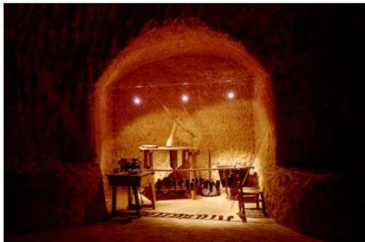
Centro de Interpretación Hábitat Troglodita Almagruz

Un espacio para el estímulo del conocimiento incluido en la red de Centros de Interpretación Etnográfica de Andalucía. (RED CIE). Este centro es miembro, además, del proyecto ROAPE (Recuperación de Oficios Artesanos en Peligro de Extinción). Se ofrecen exposiciones, actividades y rutas, cuyo objetivo es la valorización del patrimonio y medio ambiente.