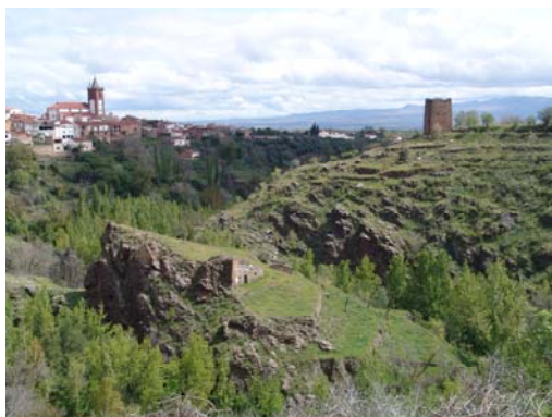
Torre del Campo. Jérez del Marquesado

Ruta de la Herencia Árabe: Los ocho siglos de historia hispano-musulmana de la Comarca de Guadix ha dejado un importante legado cultural al que nos podemos acercar a través de la ruta de la Herencia Árabe en el Marquesado. Esta ruta nos permitirá recorrer los pueblos del Marquesado y conocer lo más interesante de su patrimonio medieval: castillos, torres y atalayas, baños árabes y aljibes, además del urbanismo morisco que tan bien han sabido conservar los pueblos de esta zona de la Comarca.