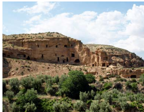
Covarrones de Cortes

Con el tiempo tanto las tipologías como el uso fueron cambiando: las cuevas se excavaron en zonas más bajas y se convirtieron en la vivienda habitual de cada familia. Desde entonces las cuevas en la Comarca de Guadix han ido evolucionando, siendo hoy día una vivienda muy apreciada y uno de los alojamientos turísticos más atractivos.