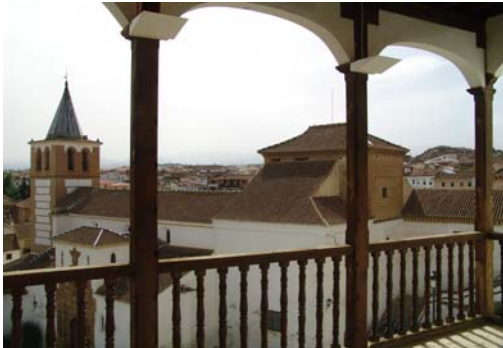
Balcón del palacio de Peñafiel

Ruta Guadix Monumental: Guadix, la llamada colonia Iulia Gemella Acci por los romanos y Wadi-As por los árabes, es una ciudad afortunada tanto por su ubicación geográfica como por su riqueza monumental. Su primer atractivo es puramente orográfico, gracias al privilegiado emplazamiento a los pies de Sierra Nevada, en la Hoya de Guadix, depresión que está rodeada de unos espectaculares farallones de tierra arcillosa. Guadix es histórica y monumental, es pasado y presente, puede presumir de ofrecer una perfecta fusión de arquitectura aristocrática y popular, civil y religiosa, en un ambiente urbano lleno de contrastes que sorprende a cada paso al visitante. La ruta de Guadix Monumental transcurre por el eje principal del casco histórico para finalizar en su singular barrio de las cuevas.