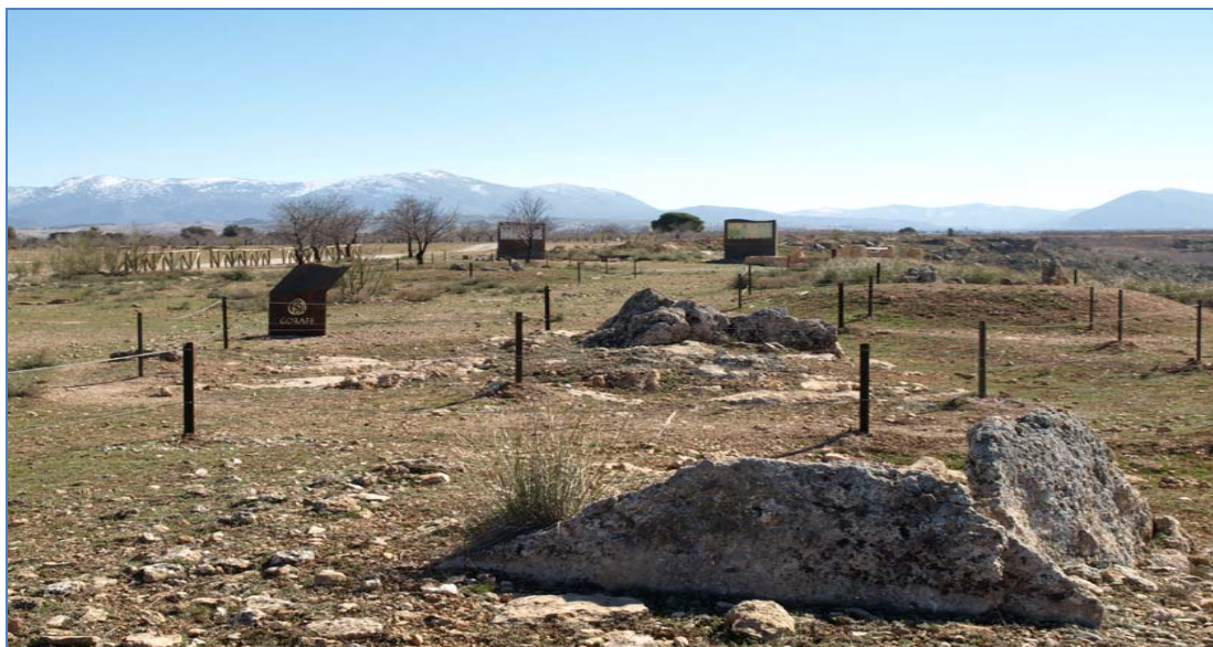
Parque megalítico de Gorafe