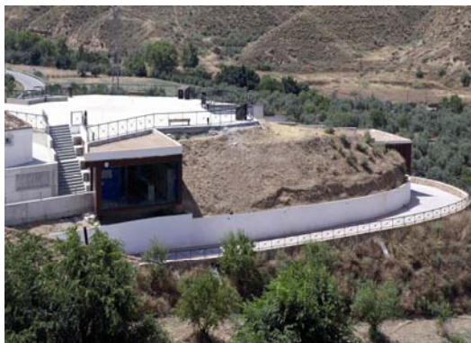
Centro de Interpretación del Megalitismo

El Centro de Interpretación del Megalitismo de Gorafe se ubica en el subsuelo de una parcela de 2.000 m 2 , su posición privilegiada lo convierte en un mirador hacia el valle. El diseño imita la forma de un sepulcro megalítico con su cámara y corredor de acceso. El Centro consta de cinco espacios expositivos con las últimas tecnologías y medios audiovisuales: como la Tecnología Bluetooth para descargarse en el teléfono móvil una aplicación con la información detallada de las tres rutas del Parque Megalítico de Gorafe o la proyección en 3D titulada «Hace 5.000 años...» que muestra aspectos de la vida y la muerte en el entorno de Gorafe.